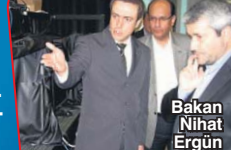
Bakan Nihat Ergün

BİLİM Sanayi ve Teknoloji Bakanı Ergün'den, gençlere 500 bin TL daha teşvik müddesi geldi. 13'TE